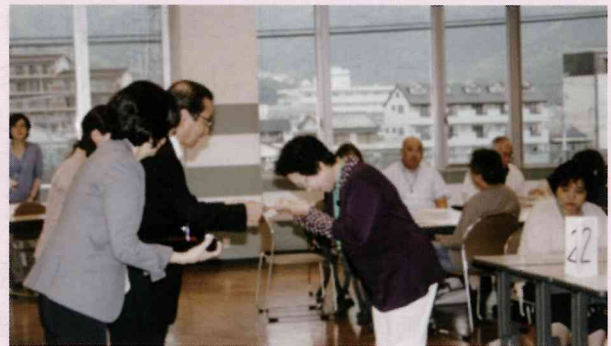
市民後見人養成講座修了証授与の様子

25年度・26年度の市民後見人養成講座修了者を対象にフォローアップ研修も実施しました。研修内容は、八幡浜市社協で後見支援員(※2)として活躍されている職員さんをお招きし、その活動内容や、後見人としての心構えや気配り等についてお話をいただきました。