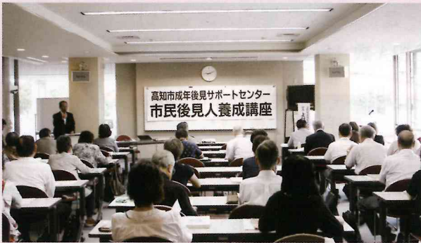
市民後見人養成講座開講の様子

そこで、センターでは、平成25年度から市民後見人養成講座を開講し、26年度も9月中旬から10月上旬にかけて7日間で19科目の講義が行われました。36名の受講者の方が熱心に受講され、うち34名の方が全課程を修了されました。