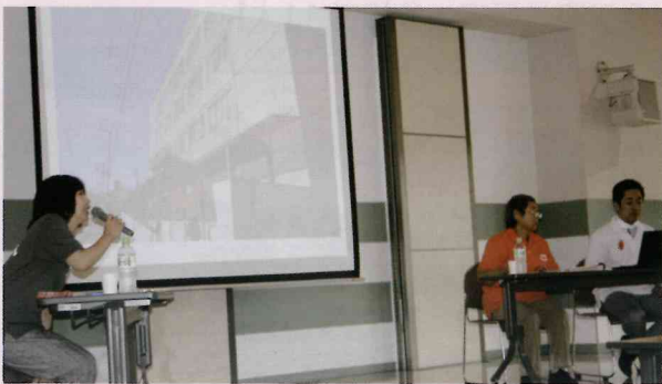
フォローアップ研修講演の様子(参加者42名)

25年度・26年度の市民後見人養成講座修了者を対象にフォローアップ研修も実施しました。研修内容は、八幡浜市社協で後見支援員(※2)として活躍されている職員さんをお招きし、その活動内容や、後見人としての心構えや気配り等についてお話をいただきました。