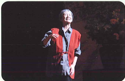
うめ子の叫び「住み慣れたこの家でいつまでも暮らしたいちや〜」