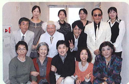
啓発劇の役者さん、劇団「微熱ろくどくぶ」の皆さん 迫真の演技ありがとうございました!