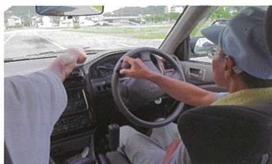
自動車運転準備講座

肢体に障害のある方の自動車運転開始につなげるための講座です。 実車での運転や運転適性検査等を行います。