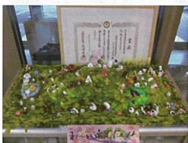
作品名「わ〜い!遠足だあ!!」