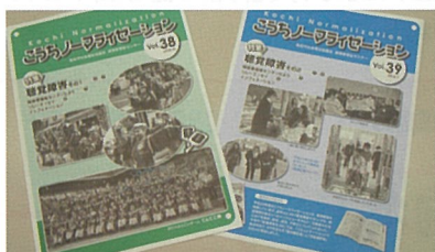
ふれあいネットワーク事業

障害者理解の促進を目的とした広報誌「こうちノーマライゼーション」を年2回発行しています。 平成26年度は、「聴覚障害」を特集しました。