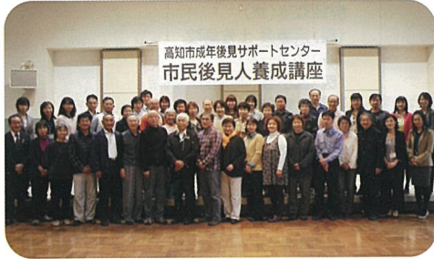
受講生全員で写真撮影

平成27年10月発行の社協だよりでお知らせしました7月の基礎編に続き、11月11日(水)～14日(土)まで応用編を開催し、基礎編と応用編を通じ30名の方が全日程を受講され、修了証をお渡ししました。この講座は、後見人の育成と成年後見制度の周知を図ることを目的として開催し、成年後見制度の必要性や重要性を学んでいただきました。今後は