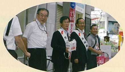
帯屋町での募金活動の様子