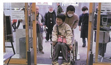
ボランティア講座

高知市内の小・中・高等学校を主な対象として、障害のある方を講師に迎え、アイマスク・車いす体験等を行っています。