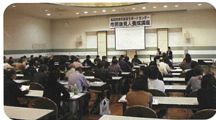
フォローアップ研修の様子

これまでに市民後見人養成講座を受講された方を対象に、フォローアップ研修を開催しました。四国で唯一市民後見人が活動されている坂出市の市民後見人さんと、後見監督人をされている坂出市社会福祉協議会の職員をお招きし、活動の実践報告や体験談などのお話をいただきました。54名の方が受講され、体験談を聞くことで市民後見人を身近に感じる機会となり、市民後見人として活動する人たちにとって大変参考となる研修になりました。