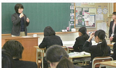
ふれあい体験学習

障害者理解の促進を目的とした広報誌「こうちノーマライゼーション」を年2回発行しています。 平成26年度は、「聴覚障害」を特集しました。