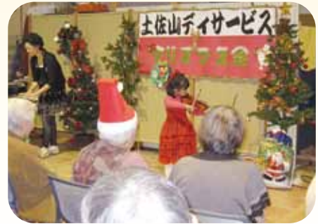
クリスマス会での楽器の演奏