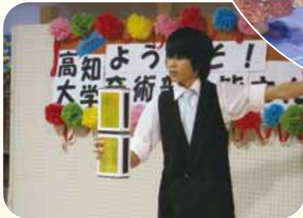
マジックショーの様子