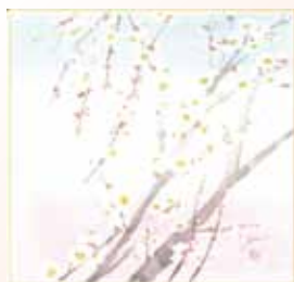
北小路 紅女 氏(日本画家)