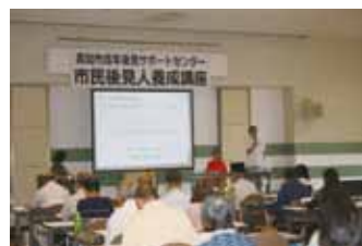
市民後見人フォローアップ研修の様子