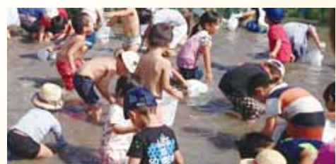
手で鮎を捕まえるこどもたちの様子