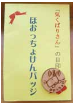
寄付金100円につき、1個進呈