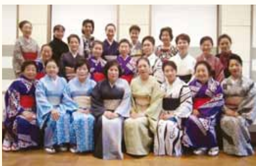
藤間流「しはな会」の皆様