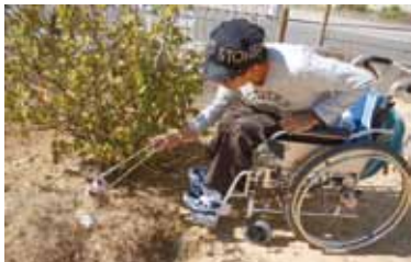
公園での清掃活動の様子

夏は木陰で休んだり、秋は銀杏の紅葉を楽しんだり、季節を問わず散歩コースとして利用している南部障害者福祉センター隣の公園の清掃活動を行っています。車椅子の利用者が火ばさみを上手に使い、公園のゴミを拾っていま