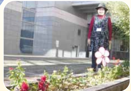
庭のお手入れをしてくださるボランティアさん