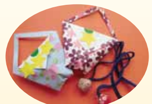
利用者手作りの【貝の根付】