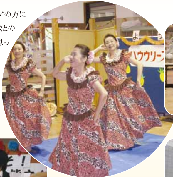
踊りのボランティアさん

ボランティアにご協力していただける方がいらっしゃいましたら、是非ご連絡ください。