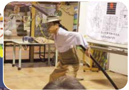
大道芸人さんによる芸の披露