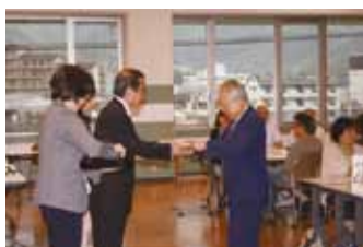
修了証授与の様子