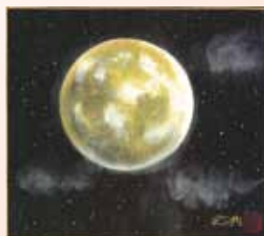
坂本 武典 氏(日本画家)