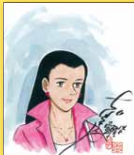
ちば てつや 氏(漫画家)