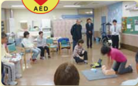
南部健康福祉センター

南部健康福祉センターでは、平成26年5月12日(月)に、(株)サニクリーン四国の社員の方を講師に迎えて職員13名がAEDの研修を受けました。