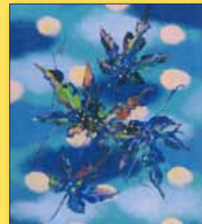
ふじい あさ氏(洋画家)