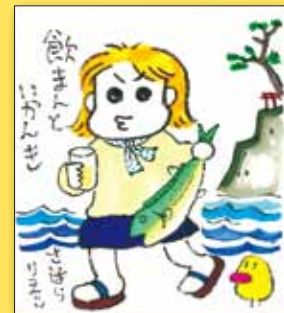
西原 理恵子氏(漫画家)