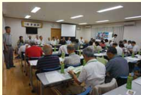
香川県観音寺市 小岡自治会館