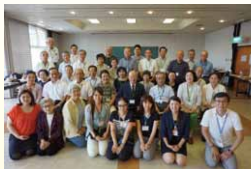
岡山県岡山市 福祉交流プラザ旭東

また、本市の地区社協の皆様方に置かれましてもお忙しい中、視察研修にご参加いただきましてありがとうございました。