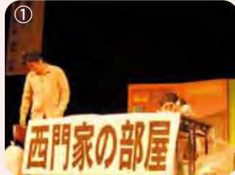
① 生活が苦しいため、家事も手につかない西門家